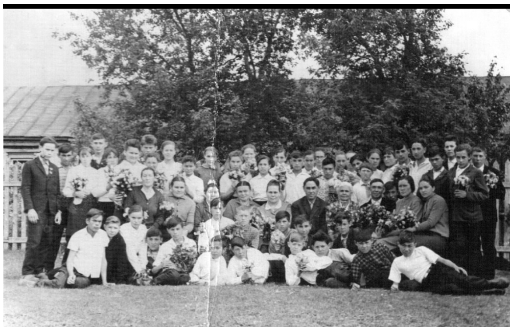
Коллектив учителей с выпускниками 1967 года